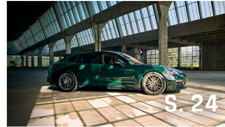
PANAMERA / SPORT TURISMO