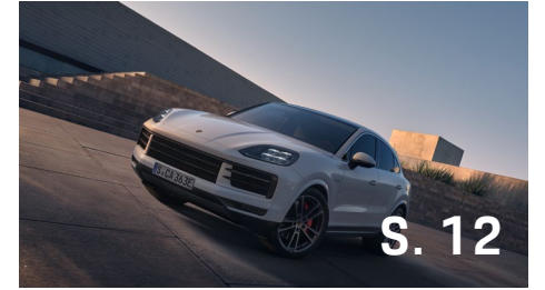
CAYENNE COUPÉ E-HYBRID